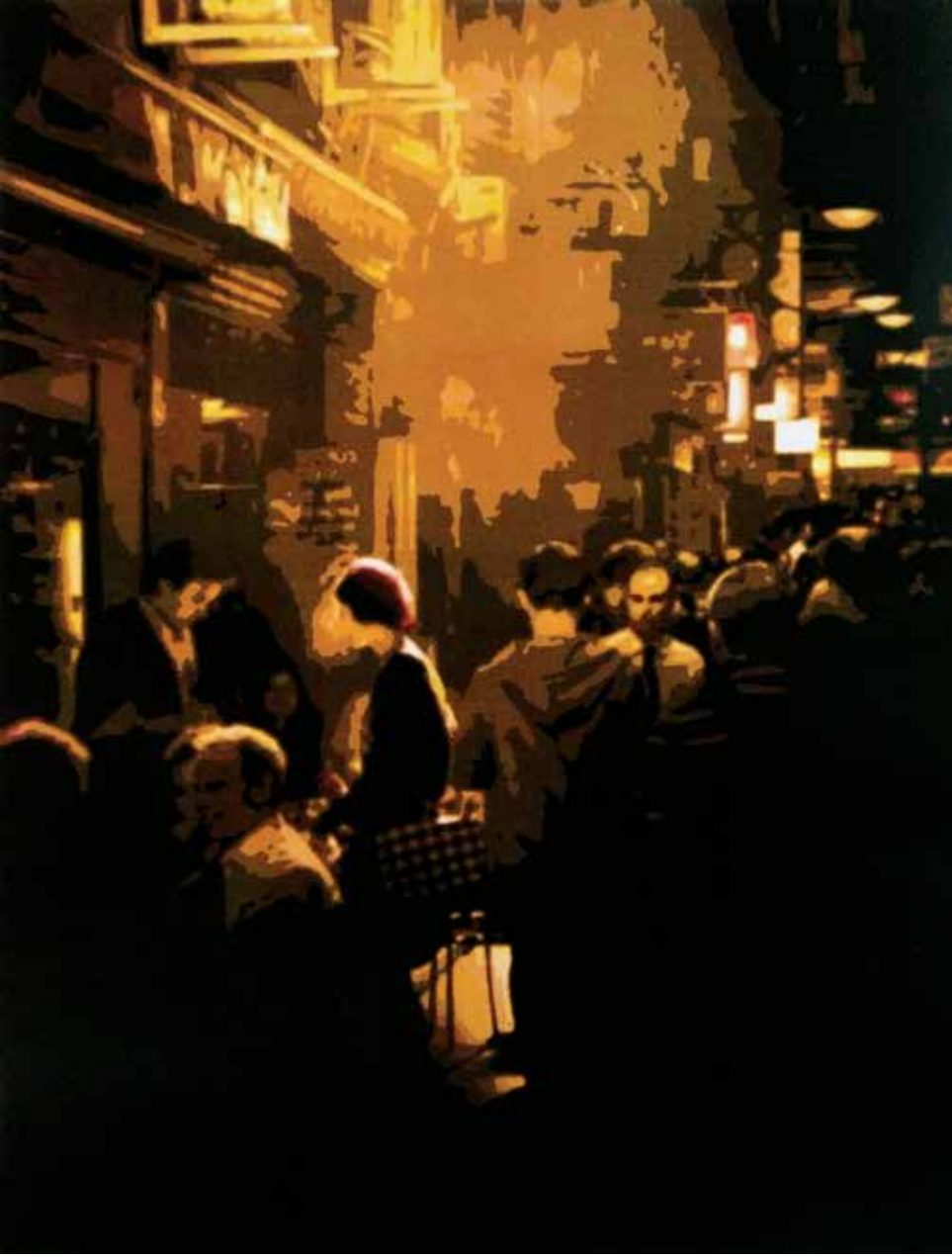
PUSLU ZAMANLAR NO:8 / MISTY TIMES Tuval Üzeri Yağlı Boya / Oil On Canvas 170 x 135 cm., 2021