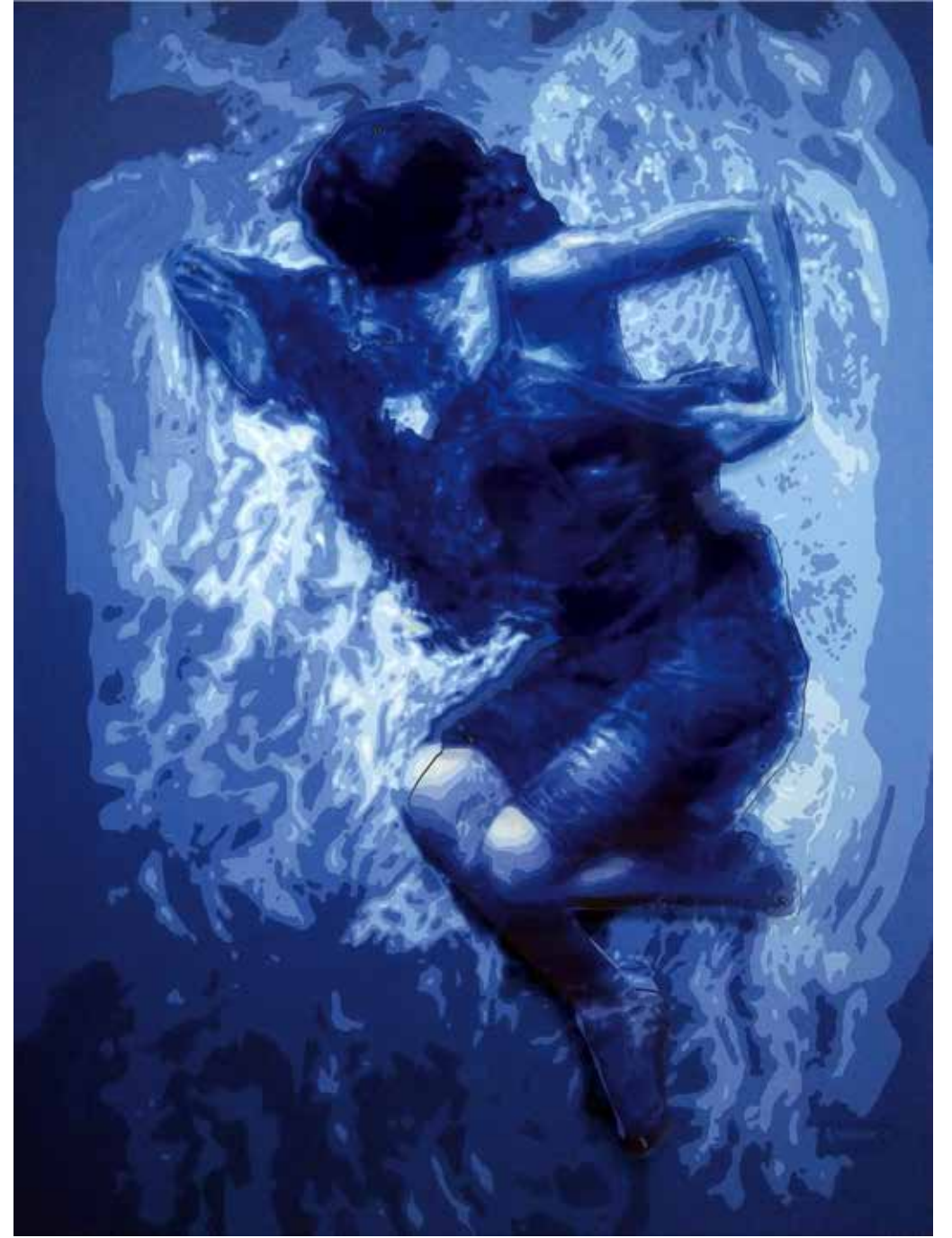
TEPETAKLAK NO:4 / UPSIDE DOWN Tuval, Pleksi, Saydam Boya / Canvas, Plexiglass, Transparent oil 175 x 130 cm., 2021