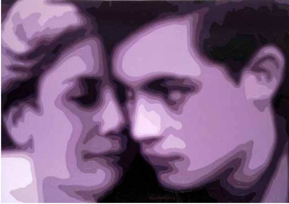
İSİMSİZ NO:10 / UNTITLED Tuval Üzeri Yağlı Boya / Oil On Canvas 100 x 170 cm., 2021