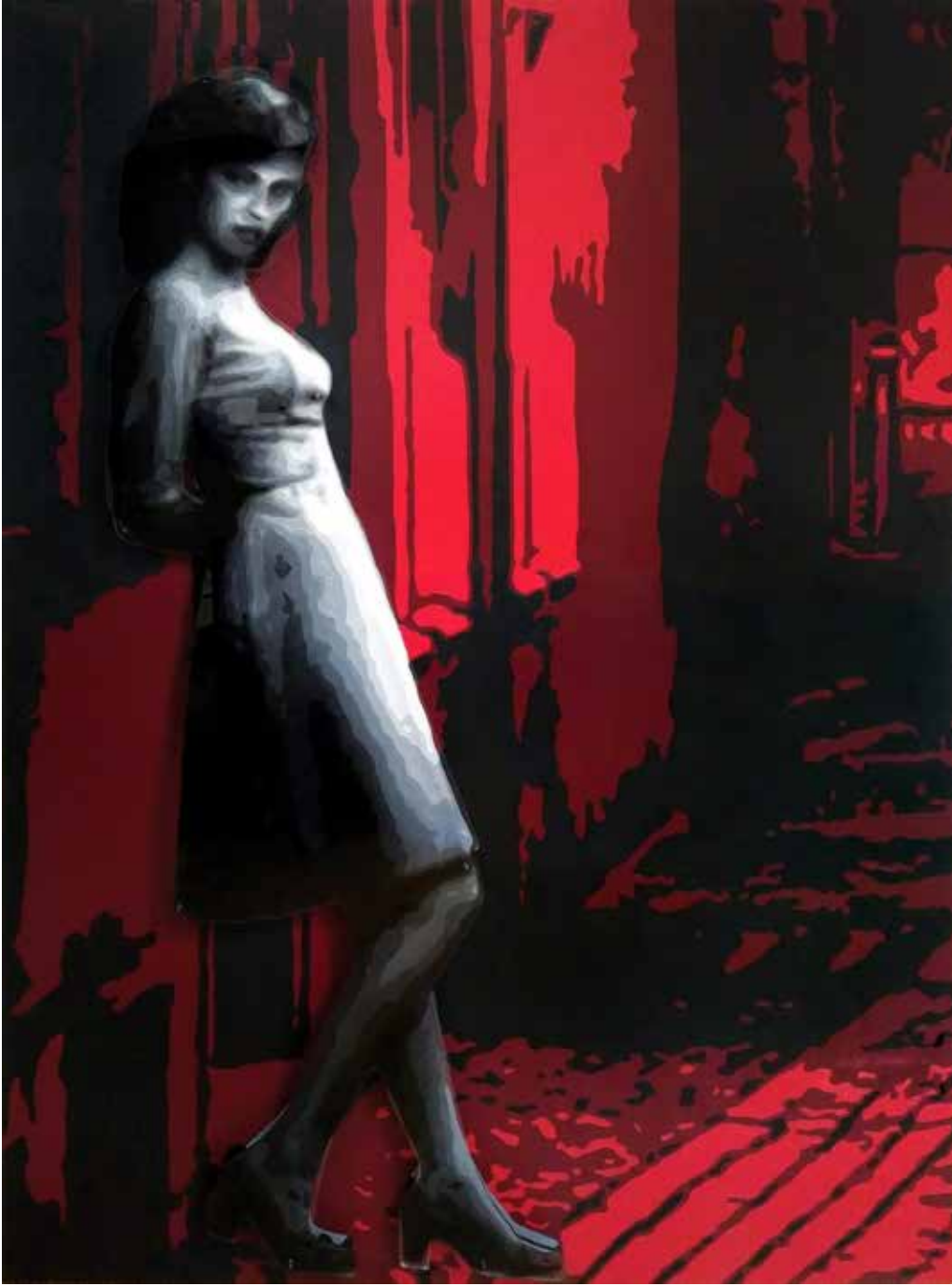
PUSLU ZAMANLAR NO:5 / MISTY TIMES Tuval, Pleksi, Saydam Boya / Canvas, Plexiglass, Transparent oil 175 x 130 cm., 2021