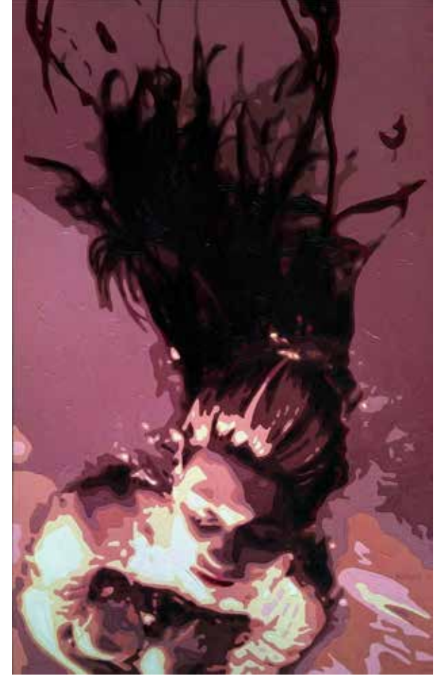
İSİMSİZ NO:11 / UNTITLED Tuval Üzeri Yağlı Boya / Oil On Canvas 90 x 56 cm., 2019