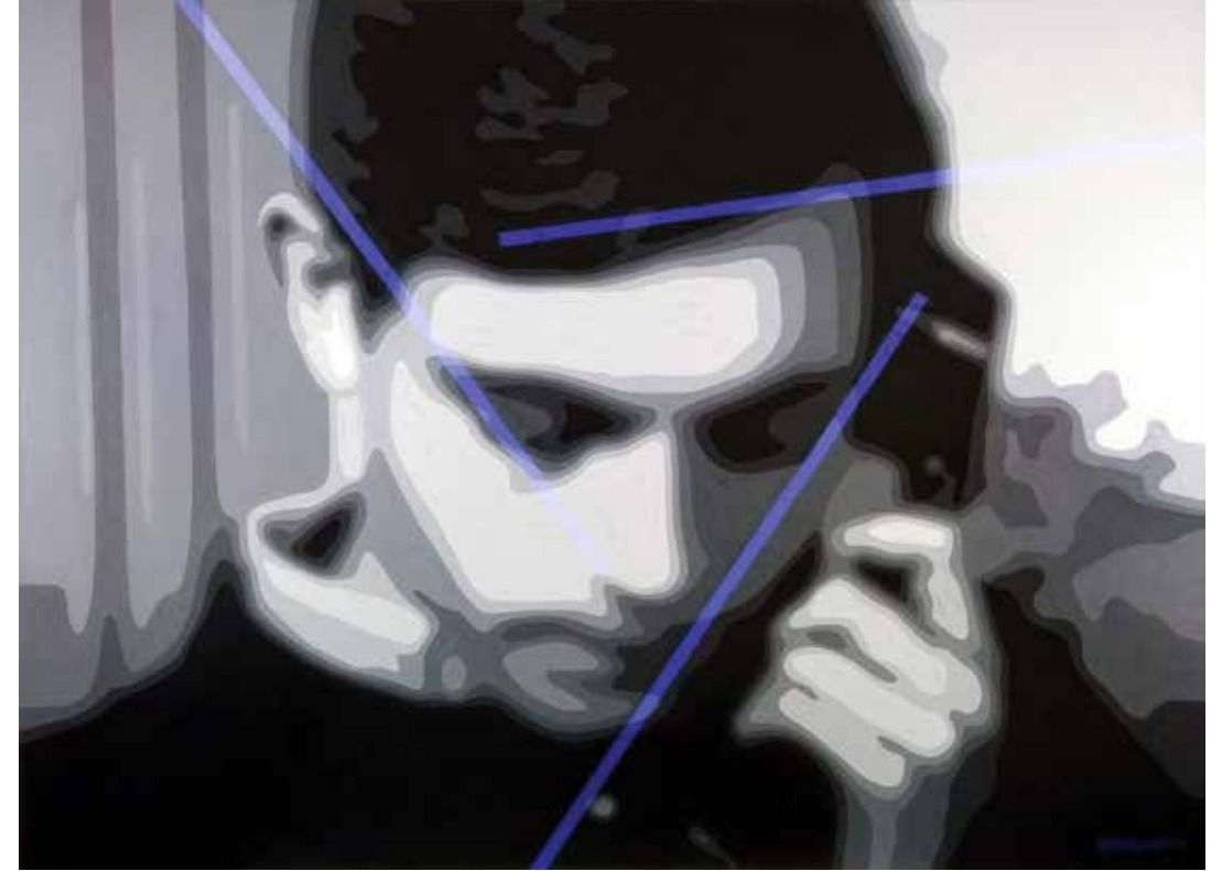
I'M BORED, CAN I COME TO YOU FOR TEA NO:9 Tuval Üzeri Yağlı Boya / Oil On Canvas 130 x 175 cm., 2019